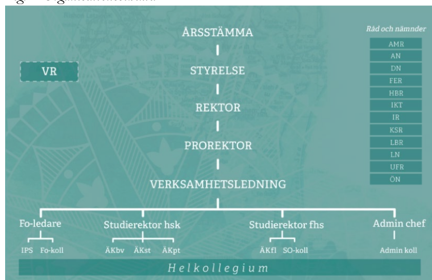
Fig. 1 Organisationsschema

Förkortningar: VR - Verksamhetsråd, Fo-ledare - Forskningsledare, IPS - Institutet för Pentekostala Studier, Fo-koll - Forskningskollegie, ÅKbv - Ämneskollegie Bibelvetenskap, ÅKst - Ämneskollegie Systematisk teologi, Ämneskollegie Praktisk teologi med kyrkohistoria, ÅKfl - Ämneskollegie Församlingsledarkurser, SO-koll - Samordnarkollegie, Admin koll - Administrativt kollegium, AMR - Arbetsmiljöråd, AN - Antagningsnämnd, DN - Disciplinnämnd, FER - Forskningsetiskt råd, HBR - Hållbarhetsråd, IKT - Råd för Informations- och kommunikationsteknologi, IR - Internationaliseringsråd, KSR - Kvalitetssäkringsråd, LBR - Likabehandlingsråd, LN - Lärarförslagsnämnd, UFR - Utbildnings- och forskningsråd, ÖN - Överklagandenämnd