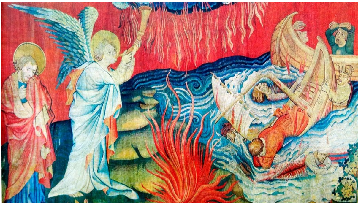
Detalj ur Apokalypstapeten i slottet i Angers, Frankrike.

För en tid sedan tillfrågades några människor på stan i radio om sin inställning till att flyga i klimatkrisens tid. En man svarade: ”Jag måste flyga eftersom jag har en lägenhet på solkusten så jag har inget val.”